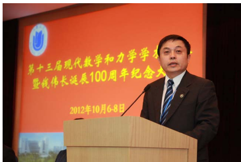
中国力学学会胡海岩理事长应邀在大会上发言

本次会议基本涵盖了应用数学和力学的最新研究成果，为相关领域的学者、工程师、在校研究生等提供了一个非常难得的学习和交流机会。此次会议的成功举办对我国应用数学和力学的发展将起到积极的推动作用，并将促进其在相关工业领域中的应用。