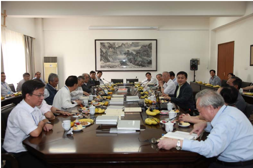
纪念钱伟长先生诞辰 100 周年座谈会